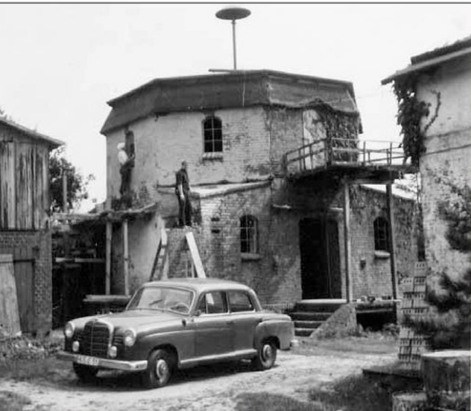
I 1967 så Mikkjelbergs mølle sådan ud.