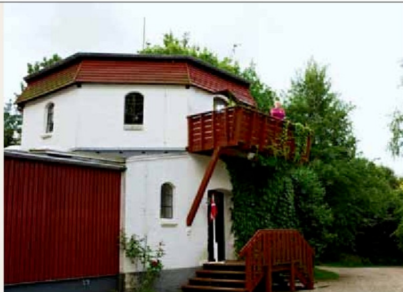
I 2009 - godt 40 år senere - er møllen forvandlet til et attraktivt kunstcenter.